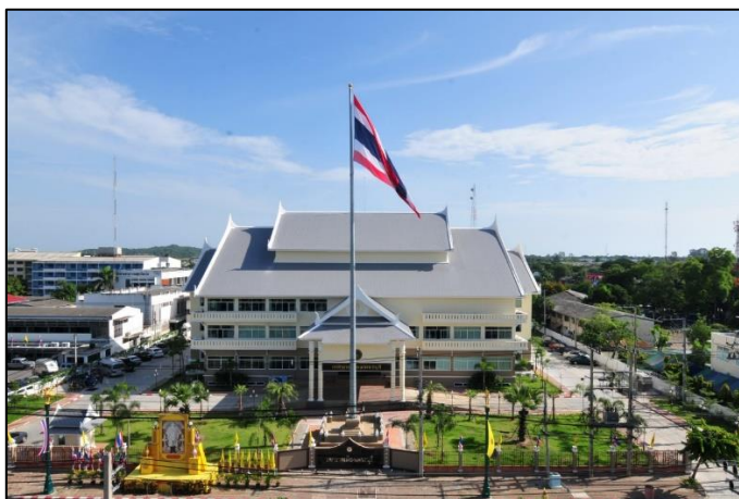
ภาพที่ 2 สำนักงานเทศบาลเมืองเพชรบุรี

เทศบาลเมืองเพชรบุรี ตั้งอยู่ เลขที่ 46/1 ถนนราชวิถี ตำบลคลองกระแซง อำเภอเมือง จังหวัดเพชรบุรี 76000 เป็นอาคาร 3 ชั้น ทรงไทย อยู่ใกล้กับที่ว่าการอำเภอเมืองเพชรบุรี วัดมหาสมณารามราชวรวิหาร (วัดเขาวัง) และสำนักงานสาธารณสุขจังหวัดเพชรบุรี มีผลการประเมินประสิทธิภาพขององค์กรปกครองส่วนท้องถิ่น (Local Performance Assessment: LPA) ในปี พ.ศ. 2563 คะแนนเฉลี่ยรวม 86.70 การประเมินคุณธรรมและความโปร่งใส (Integrity & Transparency Assessment: ITA) คะแนนเฉลี่ยรวมระดับดีมาก ได้คะแนน 87.42